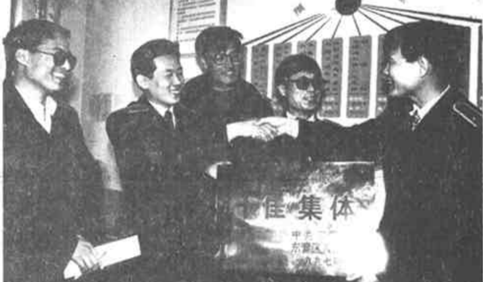
东营区法院刑事审判庭认真开展“学习谭彦做贡献,争当人民的法官”活动,全庭干警舍小家顾大家,充分发挥刑事审判职能,依法严惩各类刑事犯罪活动,加强办案力度,1996年共受理各类刑事案件148件,审结146件。